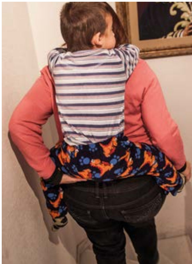
Afectado con DMD, ayudado a bajar las escaleras

La aplicación de la reserva de viviendas para personas con discapacidad, establecida por el Real Decreto Legislativo 1/2013, de 29 de noviembre, por el que se aprueba el Texto Refundido de la Ley General de derechos de las personas con discapacidad y de su inclusión social, para viviendas protegidas es del 4%.